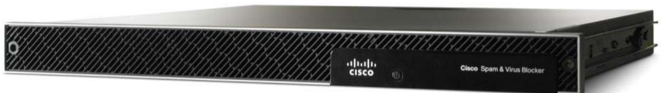
Figure 1. Cisco Spam & Virus Blocker